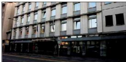
INPS SOTTO ACCUSA La sede dell'Inps a Vicenza