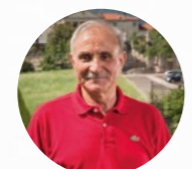
Il presidente Severino Pellizzari

La guida è scaricabile online dal sito: https://www.confartigianatovicenza.it/wp-content/uploads/2024/03/BROCHURE-ANAP-Confartigianato-Vicenza_PERSONE_2024.pdf o inquadrando il codice QRCode